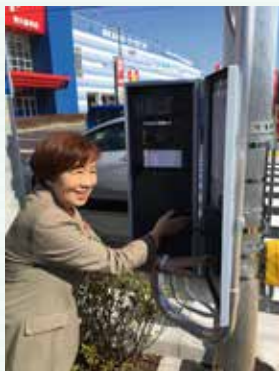
通学路の安全のため 念願の信号機が設置されました