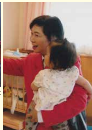
子育てしやすい環境は愛情をもって