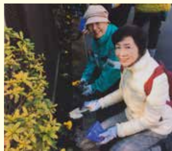
花植えボランティアは多くの人たちとともに参加