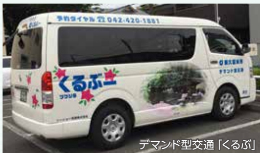
デマンド型交通「くるぶ」